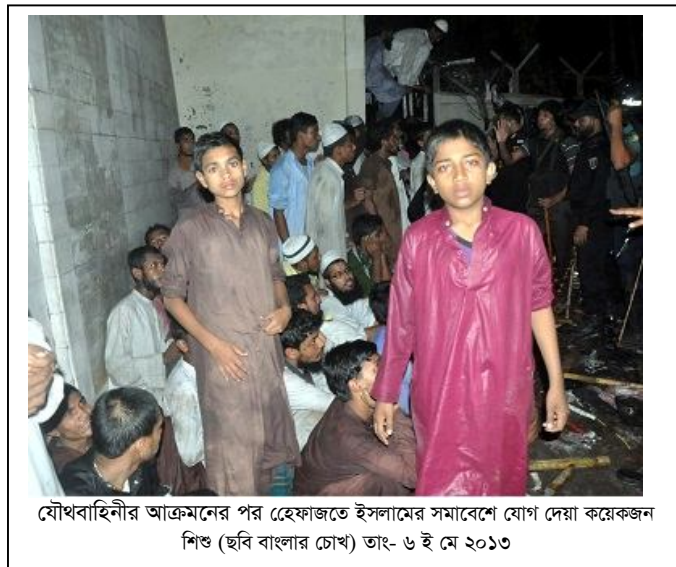
যৌথবাহিনীর আক্রমণের পর হেফাজতে ইসলামের সমাবেশে যোগ দেয়া কয়েকজন শিশু তাং- ৬ ই মে ২০১৩