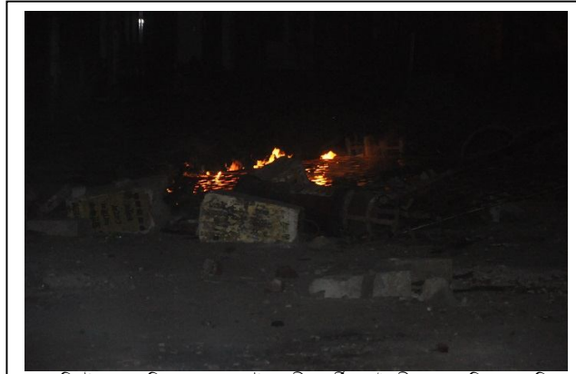
কংক্রিটের স্ল্যাব দিয়ে হেফাজতে ইসলামীর কর্মীদের তৈরী করা ব্যারিকেড ৬ মে ২০১৩

একজন নাম গোপনকৃত সাংবাদিক অধিকারকে জানান, তিনি একটি ফটো এজেন্সীর ফটোসাংবাদিক। তাঁর অফিস শাপলা চত্বরের কাছেই। ৫ মে ২০১৩ সন্ধ্যা থেকেই তিনি তাঁর অফিসে বসে হেফাজতে ইসলাম বাংলাদেশ এর কর্মসূচীর খোঁজ খবর নিচ্ছিলেন। রাত আনুমানিক ৯.৩০টায় তিনি হৈটে শুনে অফিসের জানালা দিয়ে দেখেন, হেফাজতে ইসলাম বাংলাদেশ এর কর্মীরা মতিঝিল থানার দিকে ইট-পাটকেল নিক্ষেপ করছে। মতিঝিল থানার পুলিশ সদস্যরা এসময় হেফাজত কর্মীদের ধাওয়া করে এবং এতে পুলিশ ও হেফাজত কর্মীদের মধ্যে ধাওয়া পাল্টা ধাওয়া হয়। পুলিশ হেফাজত কর্মীদের ছত্রভঙ্গ করার জন্য টিয়ার শেল, রাবার বুলেট ও সাউন্ড গ্রেনেড নিক্ষেপ করে। যার ফলে হেফাজত কর্মীরা বিভিন্ন দিকে ছুটাছুটি করে চলে যায়। রাত আনুমানিক ১০.৩০টায় মতিঝিল থানার সামনে অনেক পুলিশ এবং পূর্বানী হোটেলের সামনে থেকে শাপলা চত্বর হয়ে সিটি সেন্টার পর্যন্ত র্যাব ও পুলিশ সদস্য মোতায়েন করা হয়। তখন পরিস্থিতি শান্ত হয়ে আসে। রাত আনুমানিক ১১.৩০টায় হেফাজত কর্মীরা মতিঝিলের সিটি সেন্টার, পূর্বানী হোটেল এবং ব্যাংক এশিয়ার সামনে কাঠের টুকরা, গাছের ডাল এবং রাস্তার আইল্যান্ডের কংক্রিট স্ল্যাব দিয়ে রাস্তায় ৭-৮টি ব্যারিকেড তৈরী করে যেন যৌথবাহিনীর সদস্যরা শাপলা চত্বরের দিকে সহজে এগিয়ে আসতে না পারে।