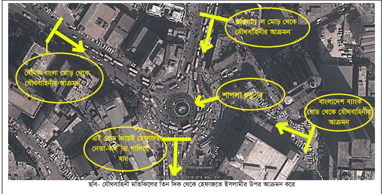
ছবি- যৌথবাহিনী মতিঝিলের তিন দিক থেকে হেফাজতে ইসলামীর উপর আক্রমণ করে

এদিকে পুলিশ, র‍্যাপিড একশন ব্যাটালিয়ন (র‍্যাব), আর্মড পুলিশ ব্যাটালিয়ন (এপিবিএন) এবং বর্ডার গার্ড বাংলাদেশ (বিজিবি) সমন্বয়ে গঠিত যৌথবাহিনীর সদস্যরা ৩টি দলে বিভক্ত হয়ে সেখানে হামলার পরিকল্পনা করে। যৌথবাহিনীর সদস্যরা পরিকল্পিতভাবে রামকৃষ্ণ মিশন (আর কে মিশন) রোডটি বাদ দিয়ে দৈনিক বাংলা মোড় থেকে ১টি, ফকিরাপুল মোড় থেকে ১টি এবং বাংলাদেশ ব্যাংকের ভেতর থেকে বের হয়ে মূল মঞ্চের দিকে ১টি, এই মোট ৩টি দলে ভাগ হয়ে একযোগে শাপলা চত্বরে অভিযান চালানোর সিদ্ধান্ত নেয়। এরপরই শুরু করে টিয়ারগ্যাস, গুলি, সাউন্ডথ্রেনেডসহ বিরতিহীন আক্রমণ। আর কে মিশন রোডটি দিয়ে অভিযান না চালানোর উদ্দেশ্য ছিল, যাতে আহত বা বেঁচে যাওয়া হেফাজত কর্মীরা আর কে মিশন রোড দিয়ে পালিয়ে রাজধানীর বাইরে চলে যেতে পারেন।