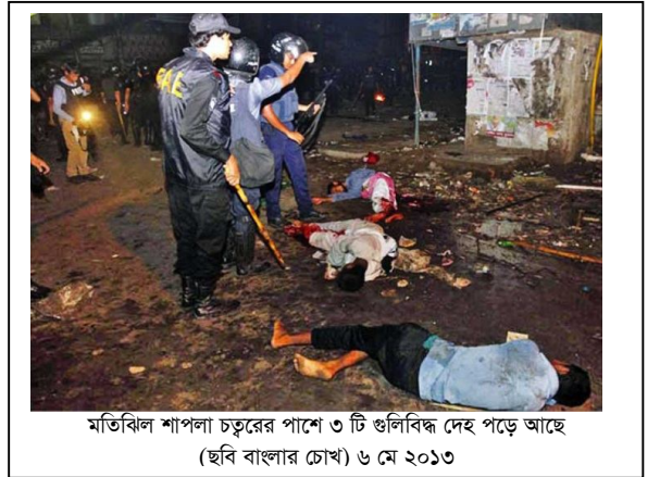
মতিঝিল শাপলা চত্বরের পাশে ৩ টি গুলিবিদ্ধ দেহ পড়ে আছে ৬ মে ২০১৩

৬ মে ২০১৩ মধ্যরাতে তিনি শাপলা চত্বরের শাপলা ভাস্কর্যের বাউন্ডারীর ভেতরে ঘুমিয়ে ছিলেন। আনুমানিক ২.৩০টায় হঠাৎ মুহুর্তে গুলির শব্দ ও টিয়ার গ্যাসের গন্ধে তাঁর ঘুম ভেঙ্গে যায়। তিনি দেখেন তাঁর চারপাশের লোকজন দৌড়ে পালাচ্ছে। তিনিও বাউন্ডারীর ভেতর থেকে বের হয়ে দৌড় দেন। এরপর তিনি টিয়ার গ্যাসে আক্রান্ত হয়ে সোনালী ব্যাংক মতিঝিল শাখার রেলিং টপকে ভেতরে প্রবেশ করলে গুলিবিদ্ধ ৭-৮ জনের নিখর দেহ সেখানে পড়ে থাকতে দেখেন। সেখানে কয়েকশ লোকও আশ্রয় নেয়। পরে পুলিশ সদস্যরা সেখানেও টিয়ার শেল নিক্ষেপ করে। এরপর সেখান থেকে ১০-১২ জনের সঙ্গে মিলে দিলখুশা রোডের একটি ভবনের সিঁড়িতে তিনি আশ্রয় নেন। তিনি দেখেন, পুলিশ সদস্যরা গাড়ী নিয়ে দক্ষিণ দিকে চলে যাচ্ছে। এমন সময় একজন পুলিশ সদস্য তাঁদের দেখে ফেলে এবং সেই পুলিশ সদস্য অন্যান্য পুলিশ সদস্যদের সেখানে ডেকে নিয়ে আসে। পুলিশ সদস্যরা এসে তাঁদের গুলি করতে চায়। তাঁরা গুলি না করার জন্য পুলিশ সদস্যদের অনুরোধ করেন। তখন পুলিশ সদস্যরা তাঁদের গুলি না করে লাঠিপেটা করে ও তাঁদের ধরে লাঠি ও রাইফেলের বাঁট দিয়ে মাথায় আঘাত করে এবং এতে তাঁর মাথা থেকে রক্তক্ষরণ হতে থাকে। এরপর তাঁদের ছেড়ে পুলিশ সদস্যরা সিঁড়িতে পড়ে থাকা অন্যদের ওপর চড়াও হয়। এই সুযোগে তিনি সেখান থেকে পালিয়ে রাস্তার পাশে একটি ডাস্টবিনের দিকে যেতে থাকেন। যাওয়ার পথে তিনি ১০-১২ জনকে রাস্তায় নিখরভাবে পড়ে থাকতে দেখেন এবং ডাস্টবিনের আড়ালে আশ্রয় নেন।