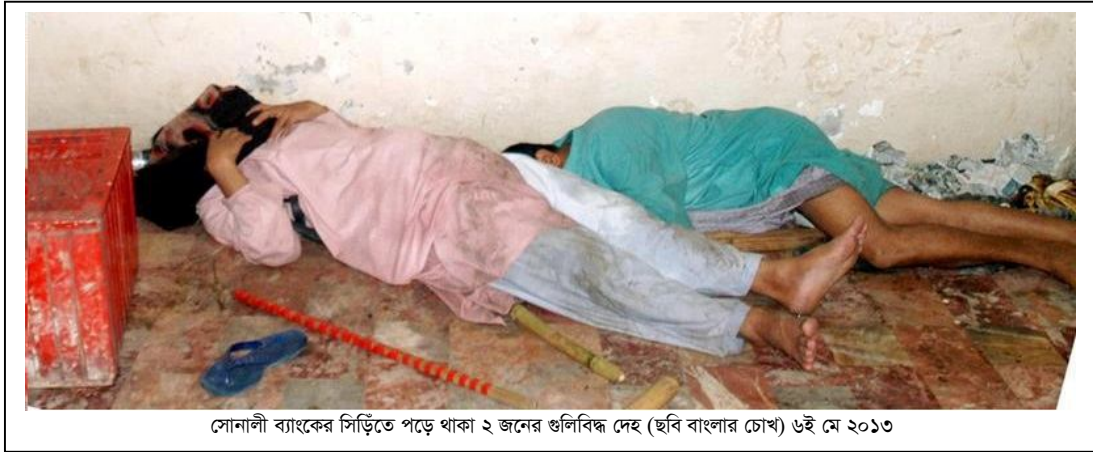
সোনালী ব্যাংকের সিঁড়িতে পড়ে থাকা ২ জনের গুলিবিদ্ধ দেহ ৬ই মে ২০১৩

তিনি এই লাশগুলোর ছবি তুলে সোনালী ব্যাংকের প্রধান কার্যালয়ে যান। সেখানে কয়েকশত হেফাজত কর্মী আশ্রয় নিয়েছিলেন। যৌথবাহিনীর সদস্যরা সেখানে গিয়ে সরাসরি গুলি করে। তিনি দেখেন, ২ জন হেফাজত কর্মী গুলিবিদ্ধ হয়ে পড়ে আছেন।