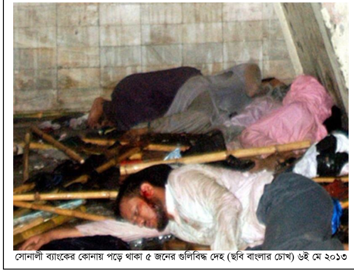
সোনালী ব্যাংকের কোনায় পড়ে থাকা ৫ জনের গুলিবিদ্ধ দেহ ৬ই মে ২০১৩

এরপর তিনি সোনালী ব্যাংকের গাড়ি পার্কিংয়ের কোনার ডান দিকের সিঁড়িতে গিয়ে দেখেন গুলিবিদ্ধ ১ জন কুঁজো হয়ে পড়ে আছেন।