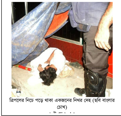
ত্রিপলের নিচে পড়ে থাকা একজনের নিখর দেহ

পুলিশ সদস্য অন্যান্য পুলিশ সদস্যদের বারণ সত্ত্বেও হেফাজত কর্মীদের লক্ষ্য করে গুলি ছুঁড়ে। তখনই গুলিবিদ্ধ হয়ে ১ জন হেফাজত কর্মী ছাদের কার্গিশে পড়ে যান। তিনি দেখেন পেট্রোল পাম্পের তেল দেয়ার মিটারের পাশে একটি ত্রিপল পড়ে আছে। তিনি সেটা তুলে দেখেন, ১ জনের গুলিবিদ্ধ লাশ সেখানে পড়ে আছে। এর পাশেই হেফাজতে ইসলামের নেতা-কর্মীদের একটি পিকআপ ভ্যান দাঁড় করানো ছিল। তিনি সেই পিকআপের ভিতরে দেখেন ১ টি লাশ পড়ে আছে।