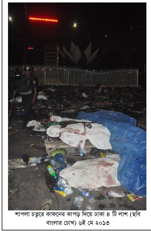
শাপলা চত্বরে কাফনের কাপড় দিয়ে ঢাকা ৪ টি লাশ ৬ই মে ২০১৩

তিনি এই লাশগুলোর ছবি তুলে সোনালী ব্যাংকের প্রধান কার্যালয়ে যান। সেখানে কয়েকশত হেফাজত কর্মী আশ্রয় নিয়েছিলেন। যৌথবাহিনীর সদস্যরা সেখানে গিয়ে সরাসরি গুলি করে। তিনি দেখেন, ২ জন হেফাজত কর্মী গুলিবিদ্ধ হয়ে পড়ে আছেন।