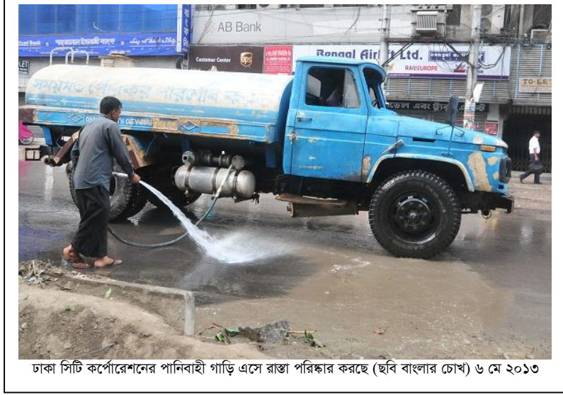
ঢাকা সিটি কর্পোরেশনের পানিবাহী গাড়ি এসে রাস্তা পরিষ্কার করছে ৬ মে ২০১৩

৪.৩০টা পর্যন্ত তিনি গুলির শব্দ পান। গুলির শব্দ থেমে গেলে ভোর আনুমানিক ৬.০০টায় তিনি ব্যাংক থেকে বের হন। তখন তিনি রাস্তায় কোন ব্যক্তির লাশ দেখতে না পেলেও রাস্তার বিভিন্ন জায়গায় ছোপ ছোপ রক্তের দাগ দেখতে পান। তিনি লক্ষ্য করেন, ঢাকা সিটি কর্পোরেশনের লোকজন এসে রাস্তায় পানি ঢেলে রাস্তা ধুয়ে ফেলছে।