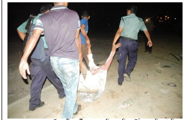
একজন হেফাজতে ইসলামীর কর্মীর মৃতদেহ নিয়ে গাড়িতে উঠাচ্ছে পুলিশ ৬ মে ২০১৩