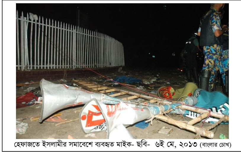
হেফাজতে ইসলামীর সমাবেশে ব্যবহৃত মাইক- ছবি- ৬ই মে, ২০১৩ (বাংলার চোখ)

এদিকে পুলিশ, র‍্যাপিড একশন ব্যাটালিয়ন (র‍্যাব), আর্মড পুলিশ ব্যাটালিয়ন (এপিবিএন) এবং বর্ডার গার্ড বাংলাদেশ (বিজিবি) সমন্বয়ে গঠিত যৌথবাহিনীর সদস্যরা ৩টি দলে বিভক্ত হয়ে সেখানে হামলার পরিকল্পনা করে। যৌথবাহিনীর সদস্যরা পরিকল্পিতভাবে রামকৃষ্ণ মিশন (আর কে মিশন) রোডটি বাদ দিয়ে দৈনিক বাংলা মোড় থেকে ১টি, ফকিরাপুল মোড় থেকে ১টি এবং বাংলাদেশ ব্যাংকের ভেতর থেকে বের হয়ে মূল মঞ্চের দিকে ১টি, এই মোট ৩টি দলে ভাগ হয়ে একযোগে শাপলা চত্বরে অভিযান চালানোর সিদ্ধান্ত নেয়। এরপরই শুরু করে টিয়ারগ্যাস, গুলি, সাউন্ডথ্রেনেডসহ বিরতিহীন আক্রমণ। আর কে মিশন রোডটি দিয়ে অভিযান না চালানোর উদ্দেশ্য ছিল, যাতে আহত বা বেঁচে যাওয়া হেফাজত কর্মীরা আর কে মিশন রোড দিয়ে পালিয়ে রাজধানীর বাইরে চলে যেতে পারেন।