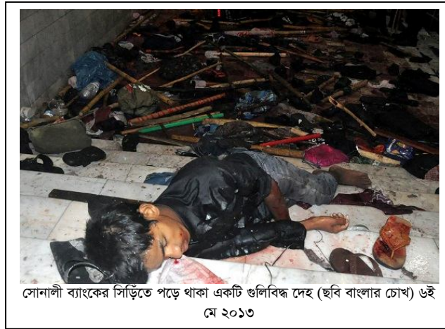
সোনালী ব্যাংকের সিঁড়িতে পড়ে থাকা একটি গুলিবিদ্ধ দেহ ৬ই মে ২০১৩

এরপর তিনি সোনালী ব্যাংকের গাড়ি পার্কিংয়ের কোনার ডান দিকের সিঁড়িতে গিয়ে দেখেন গুলিবিদ্ধ ১ জন কুঁজো হয়ে পড়ে আছেন।